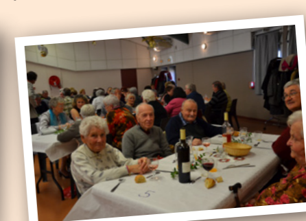
Repas de Noël du CCAS