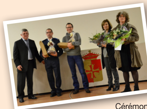
Cérémonie de présentation des vœux du Maire et du Conseil Municipal