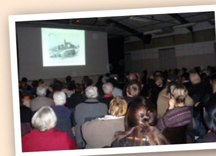
Diaporamas de photos anciennes du village