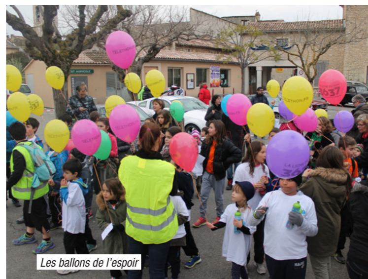
Les ballons de l'espoir