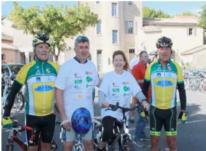
Le rallye des élus