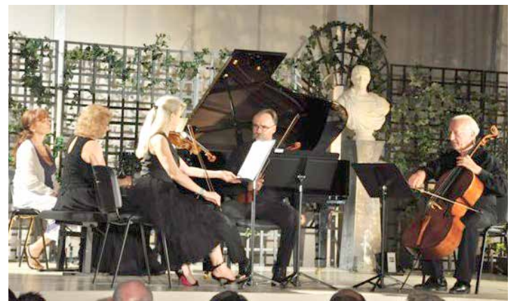
Les musicales de Saint-Didier