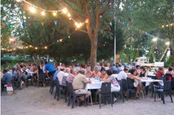
Fête du Barbaras