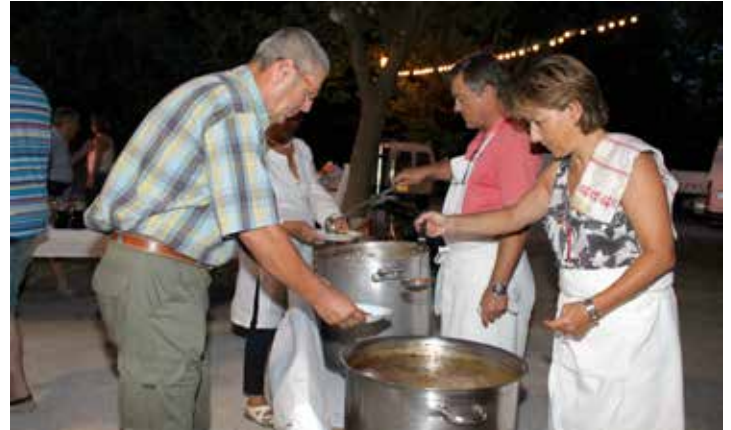
Soirée Pistou Jazz