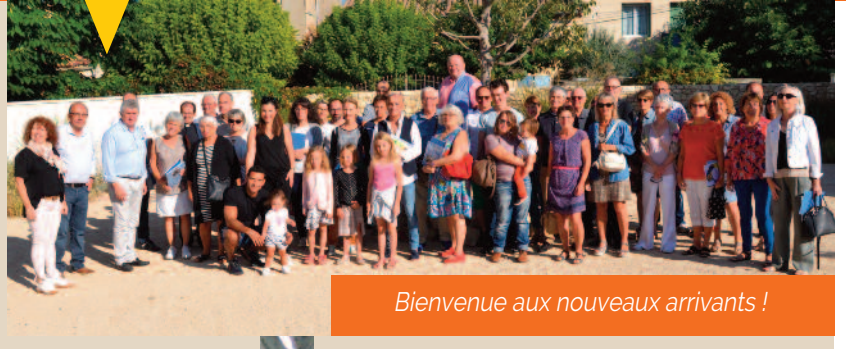
Bienvenue aux nouveaux arrivants !