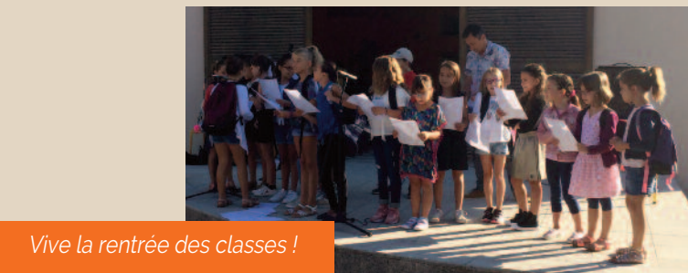
Vive la rentrée des classes !