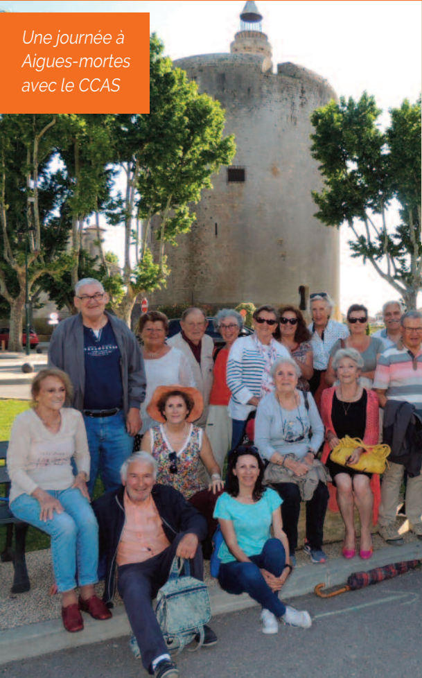
Une journée à Aigues-mortes avec le CCAS