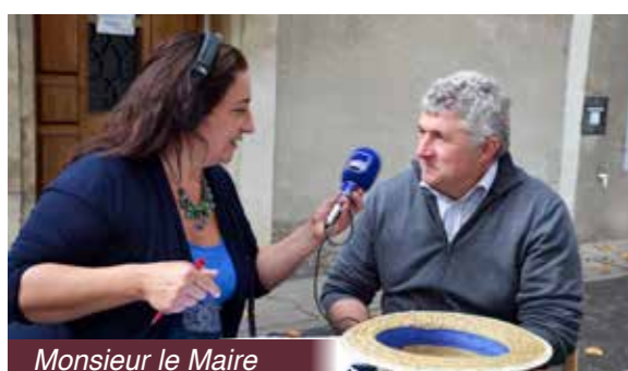
Monsieur le Maire

A deux reprises au cours de l'été, France Bleu Vaucluse est venu diffuser ses émissions « Un jour chez vous » en direct du marché forain. Associations, entreprises, élus, conservateurs du patrimoine ont été interviewé pour réaliser un portrait fidèle de Saint-Didier.