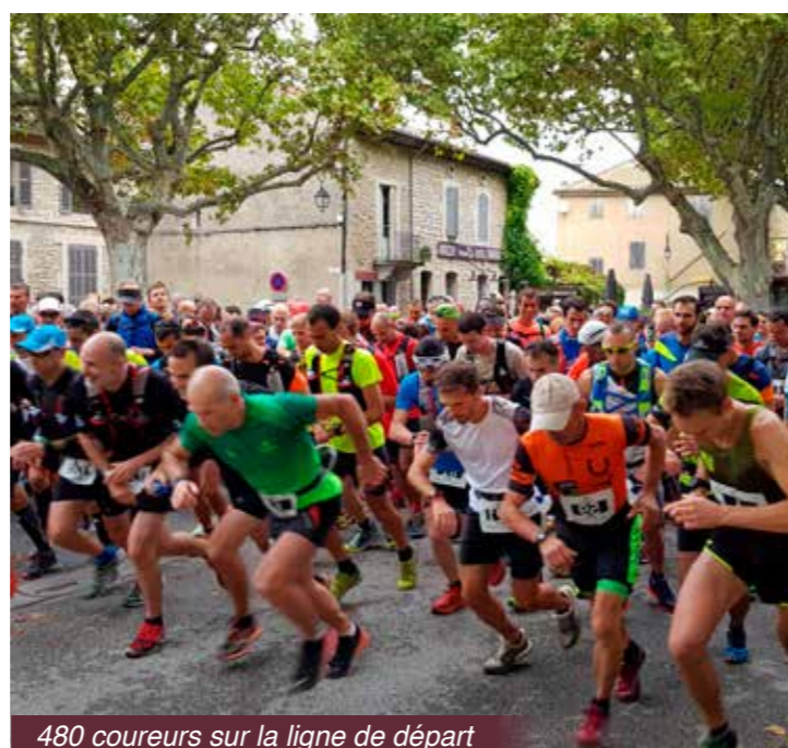
480 coureurs sur la ligne de départ