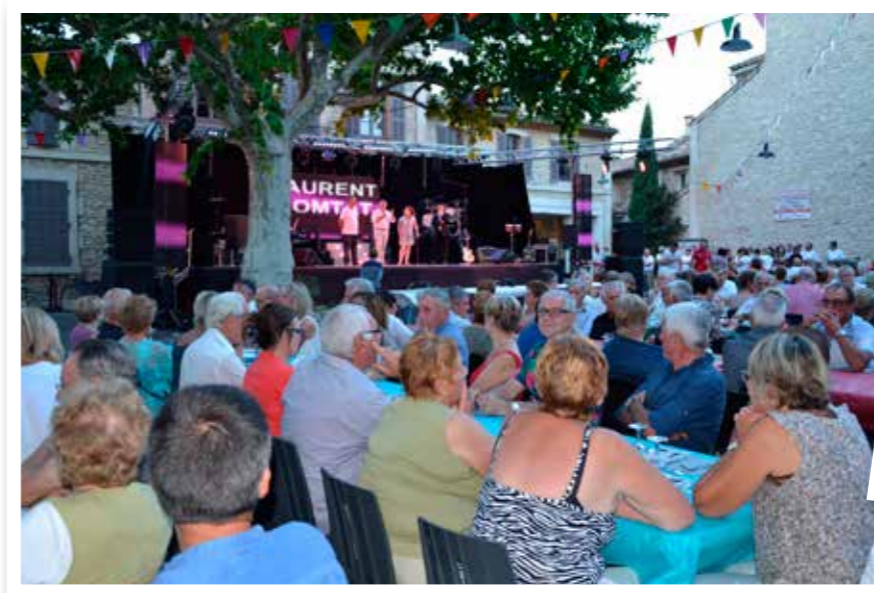
Fête votive 2016