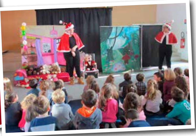
Noël aux écoles ...