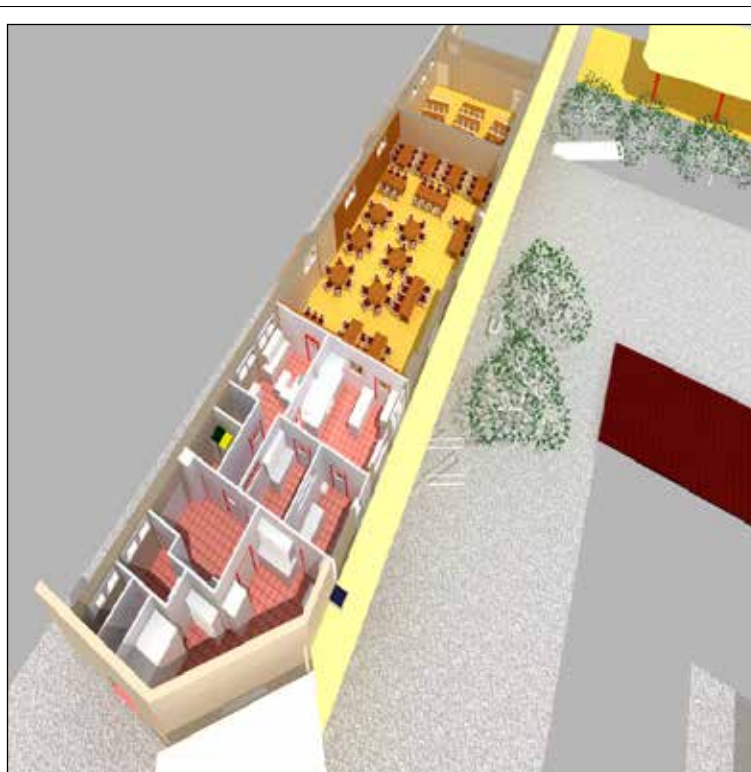
Vue d'ensemble après travaux.

Les temps scolaire et périscolaire cohabiteront donc avec les travaux pendant l'année scolaire 2016-2017 et seront organisés en conséquence. Un périmètre de chantier sécurisé sera donc installé autour de la zone de travaux. Il empiètera légèrement sur la cour, l'entrée et le parvis de l'école. La partie la plus importante de la zone de chantier sera installée sur la chaussée allée de la Gardette où le stationnement sera réduit et où un sens unique de circulation sera mis en place. Le service de restauration sera maintenu pendant toute la durée des travaux.